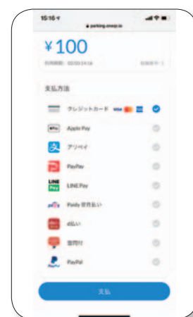
決済画面サンプル