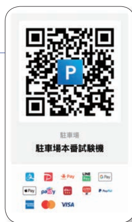
QRコード表示サンプル

OneQRは、駐車場・駐輪場サービスに最適化したモバイルアプリケーションSaaSです。精算用のQRコードを掲げるだけで、複数のモバイル向け決済に対応可能なオールインワンソリューションです。精算機を操作すること無く、スマートフォン上で全ての操作が可能のため利用者の利便性も向上します。初期費用は無料で駐車場1カ所当たり月額500円の低コストで運用可能(注2)。