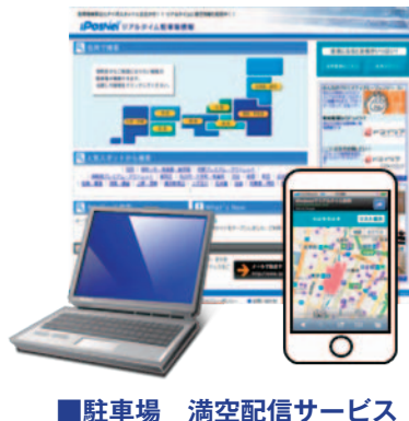
■駐車場 満空配信サービス