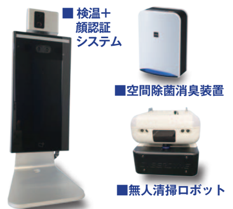
■検温+顔認証システム