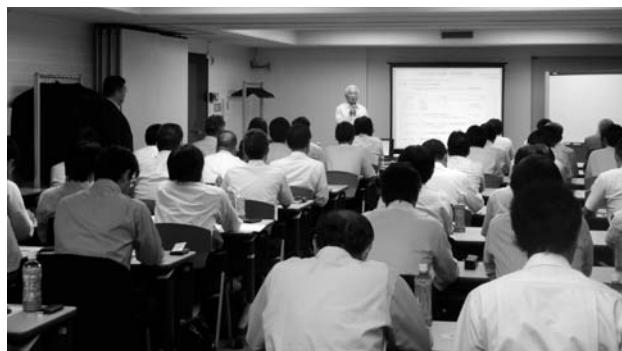
第1回本部研修会の様子

研修会終了後、同会場にて情報交換懇談会が行われ、和気藹々とした雰囲気の中で、会員会社はもとより、講師等の情報交換や交流が図られた。