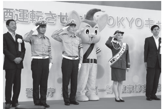
お笑いタレント・友近氏がキャンペーン隊長に任命された

第二部の交通総務課職員による交通安全教室では、友近氏が警視庁のマスコットキャラクター・ピーポくんとともに飲酒運転の危険性について解説した。