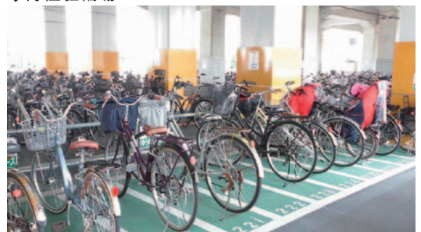
有人管理駐輪場(35カ所)の一部では、幅広区画「ゆうゆうスペース」を導入。