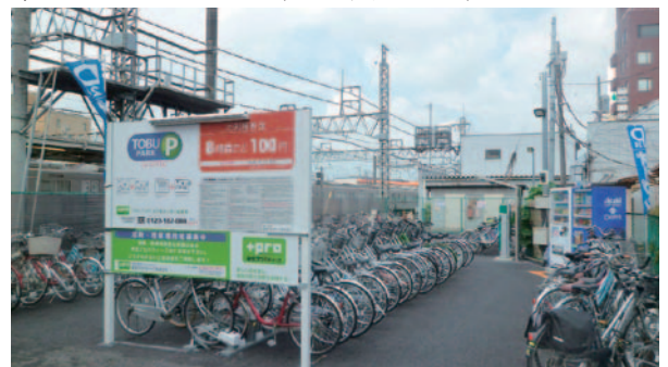
30台から700台規模まで、大小さまざまな時間貸駐輪場110カ所を運営。