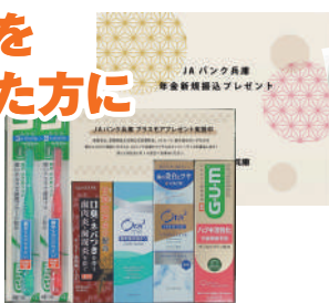
サンスター「ハミガキセット」