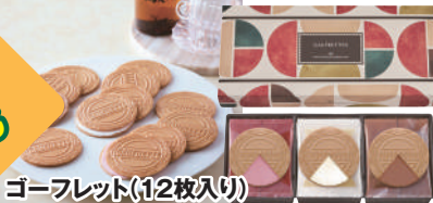
ゴーフレット(12枚入り)