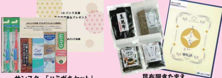
サンスター「ハミガキセット」