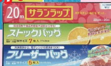
ロイヤルスタイルキッチンセット