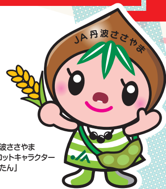
JA丹波ささやま マスコットキャラクター 「ささたん」