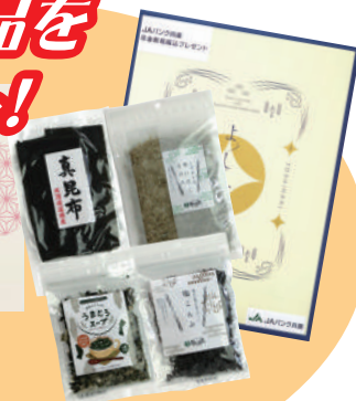
昆布屋きたまえ「オリジナルギフトセット」

※複数の年金のお振込につきましても、お一人様につき1点となります。 ※パッケージデザインは変更する場合がございます。