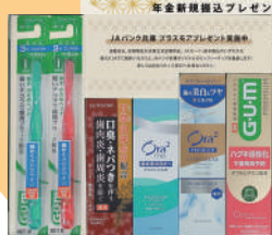
サンスター「ハミガキセット」