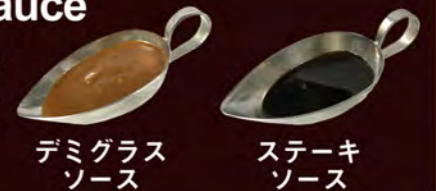
デミグラス ソース