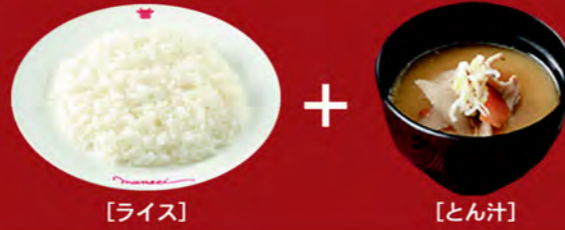
[ライス] + [とん汁]