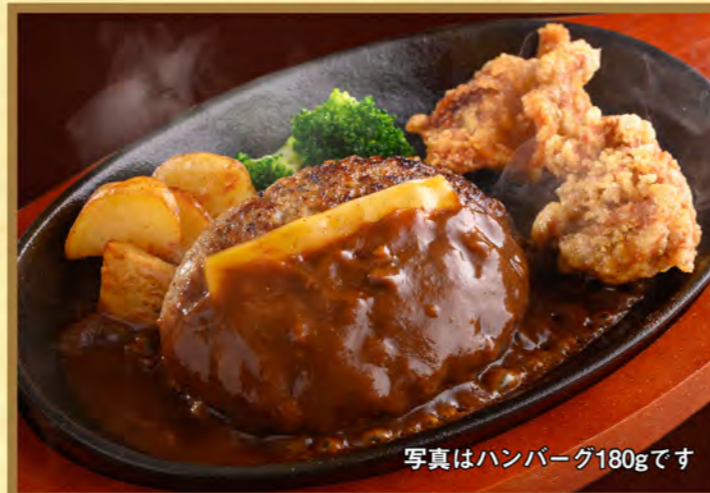
写真はハンバーグ180gです