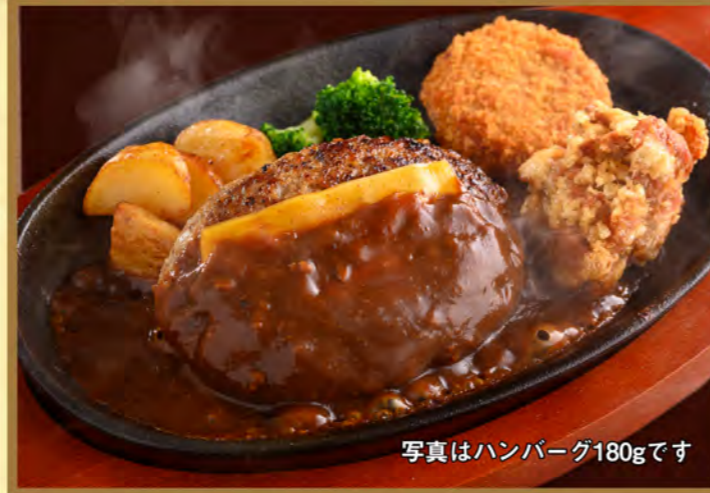
写真はハンバーグ180gです

ハンバーグ 120g 1380 円(税込1518円) ハンバーグ 180g 1640 円(税込1804円)