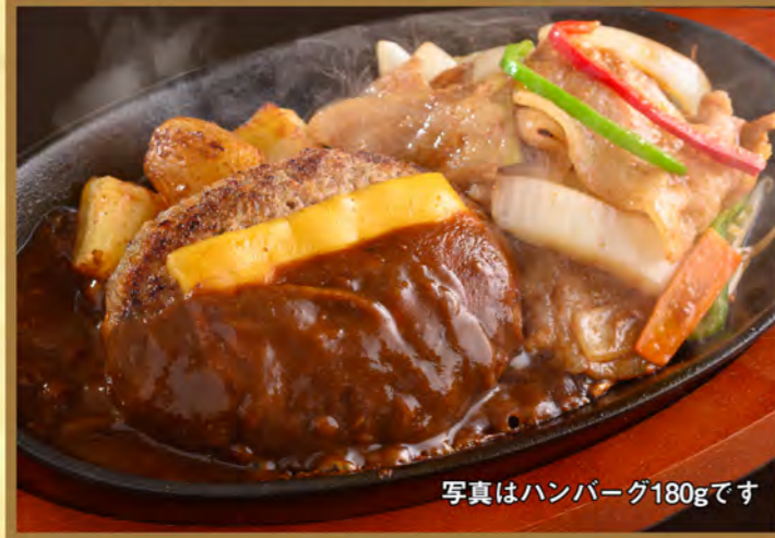
写真はハンバーグ180gです