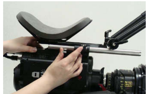
ETショルダーを取り付ける