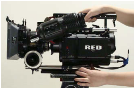
ベースプレートからカメラを取り外す