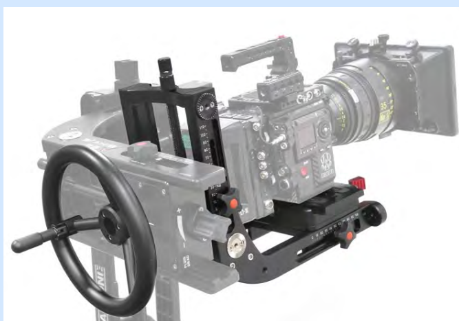
■ パン・チルト・ロールの動きで、被写体をしっかり追跡。