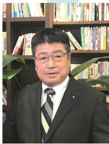
公認会計士・税理士